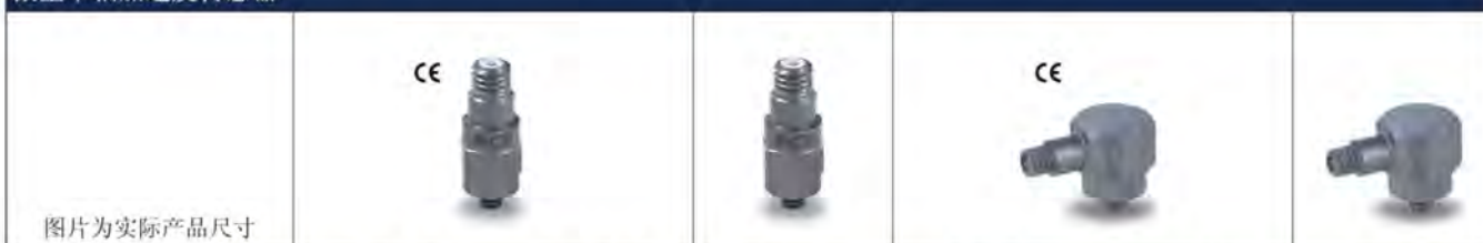
微型单轴加速度传感器