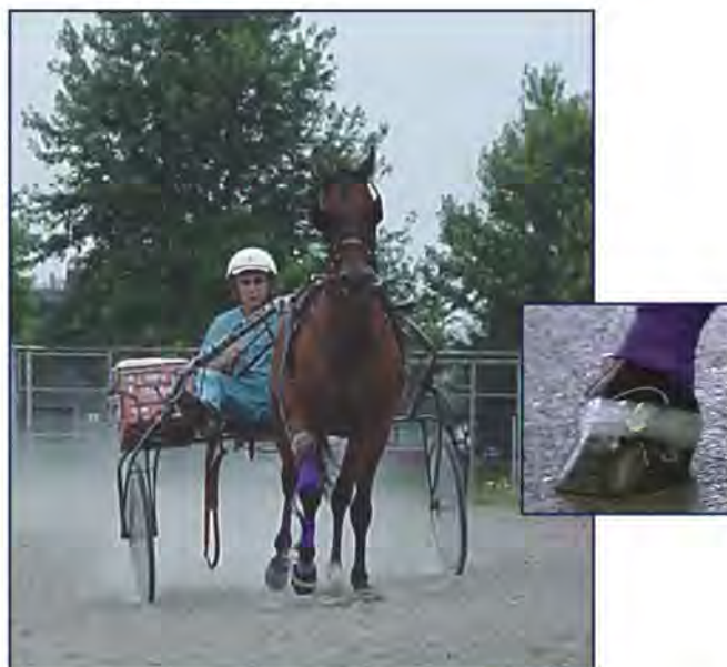
小型单轴加速度传感器

在体育竞技中，微小的优势就能决定输赢。生物工程研究可以帮助了解生物的全部潜力并且调整到最佳身体机能，还可以确定受伤后愈合的进展与成效。PCB®加速度传感器已经被用来满足多种测试要求，其中包括产品测试、设计检验、结构分析甚至运用到动物行为研究领域。